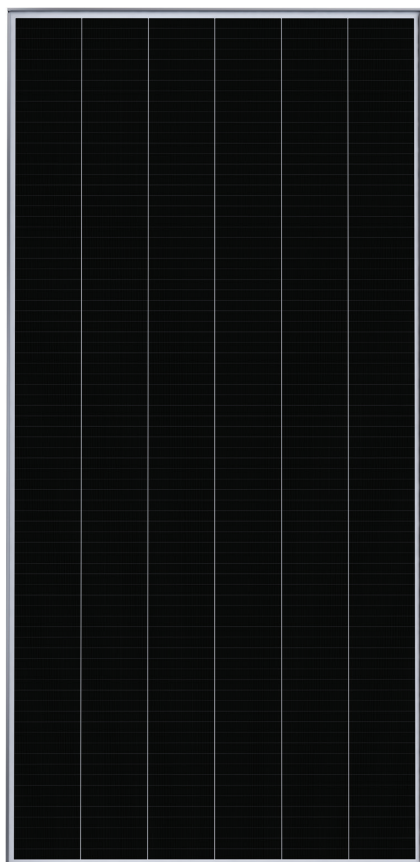
Paneles Solares SunPower Performance 3 - P3-COM

Una garantía mejor se basa en un producto mejor.